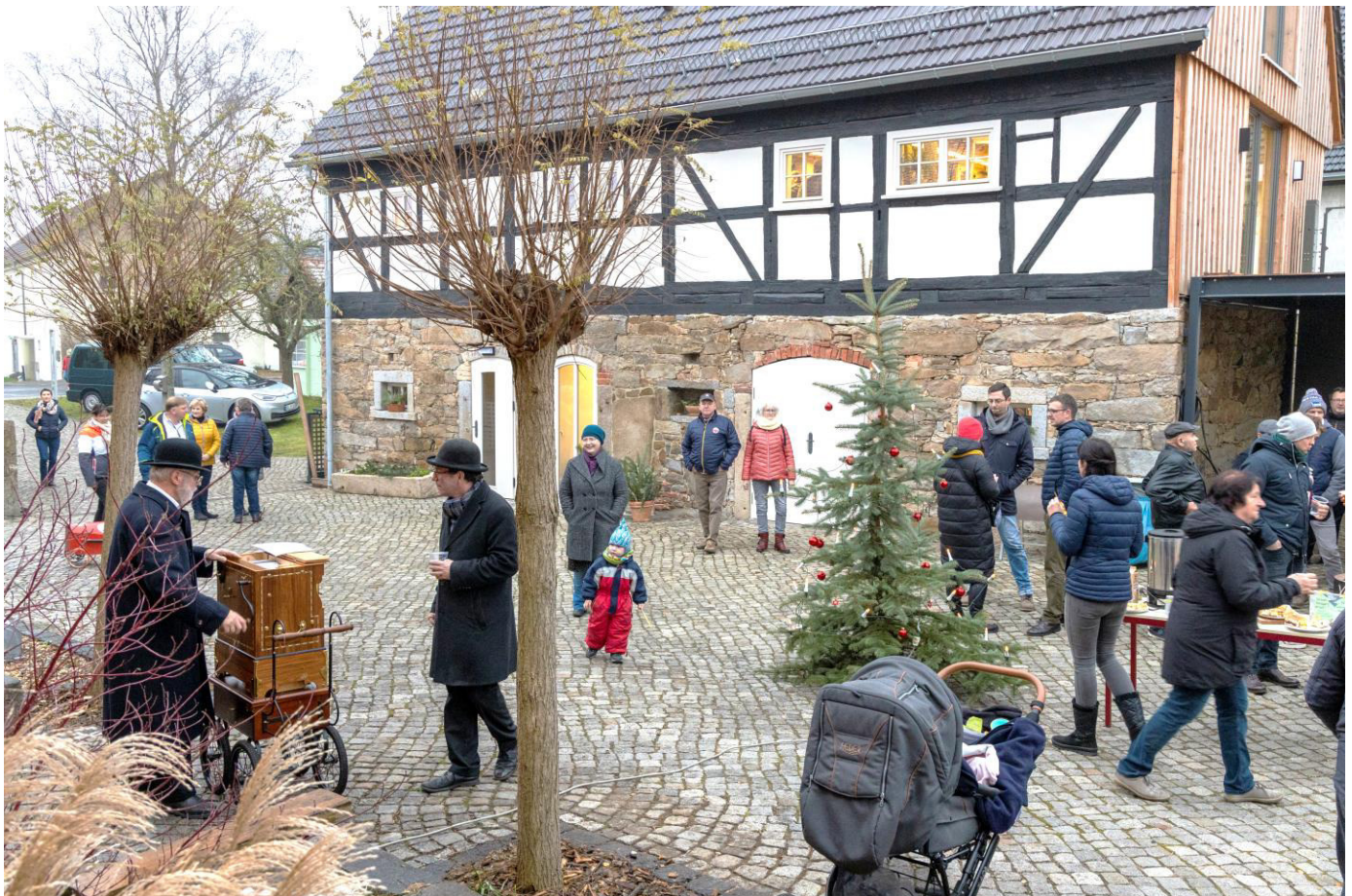
Vorweihnachtliche Atmosphäre anlässlich der Wiedereröffnung der Manufaktur Buck im Dezember in Rosenthal

www.ralbitz-rosenthal.de gemeinde@ralbitz-rosenthal.de