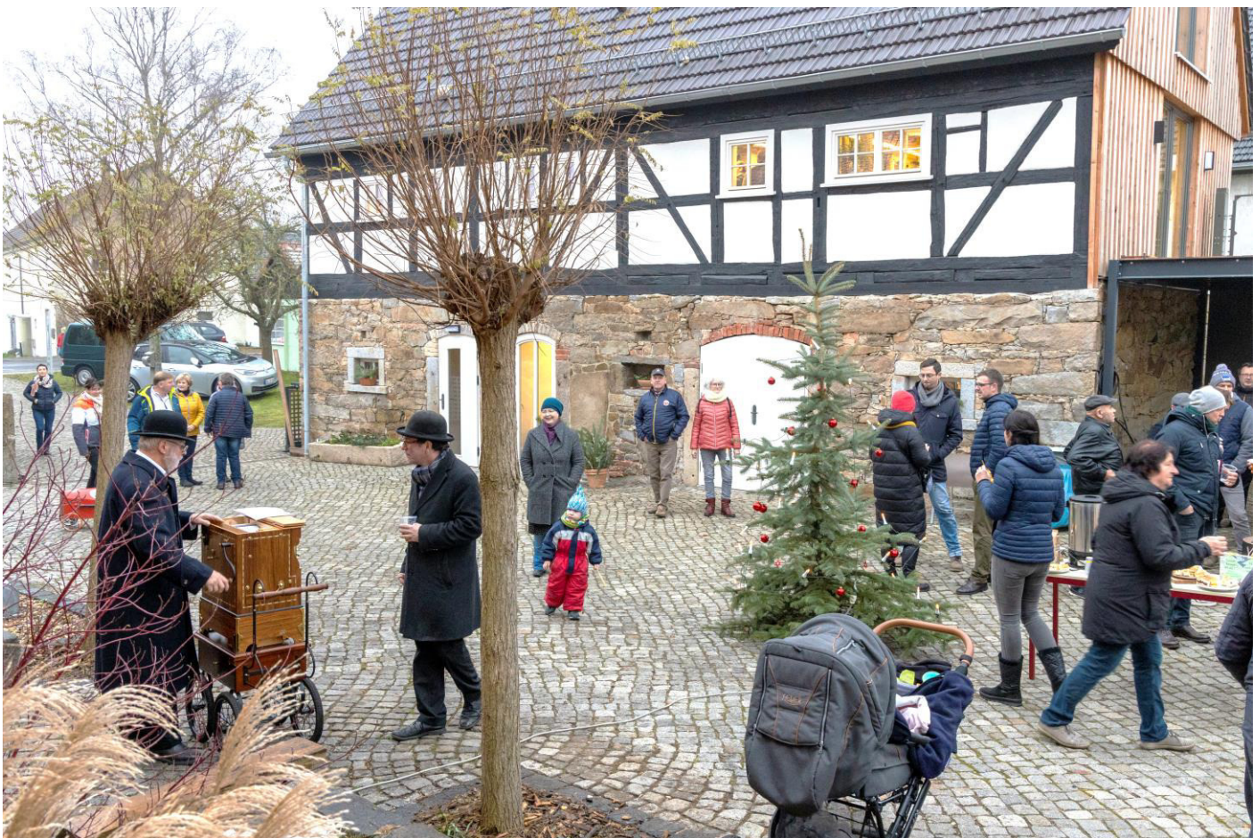
Dohodowna atmosfera składnostnje znawotewrjenja Bukec manufaktury w decembrje w Róžeńće

34. lětnik / 7. wudaće Hamske łopjeno wulki rózka 2023 21.12.2022 www.ralbitz-rosenthal.de gemeinde@ralbitz-rosenthal.de