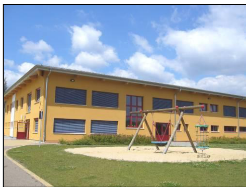
Serbskŕ zakłŕadna ŕula Raibicy