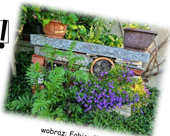
wobraz: Fabian Korch