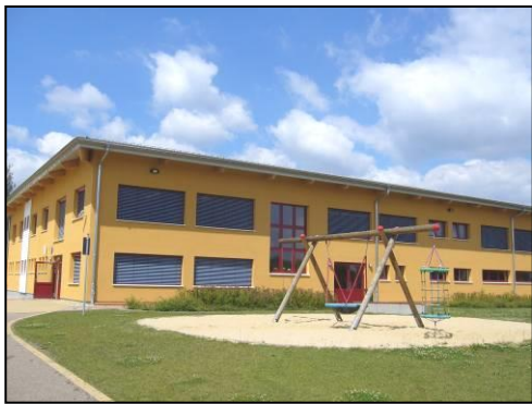
Serbska zakladna šula Ralbicy