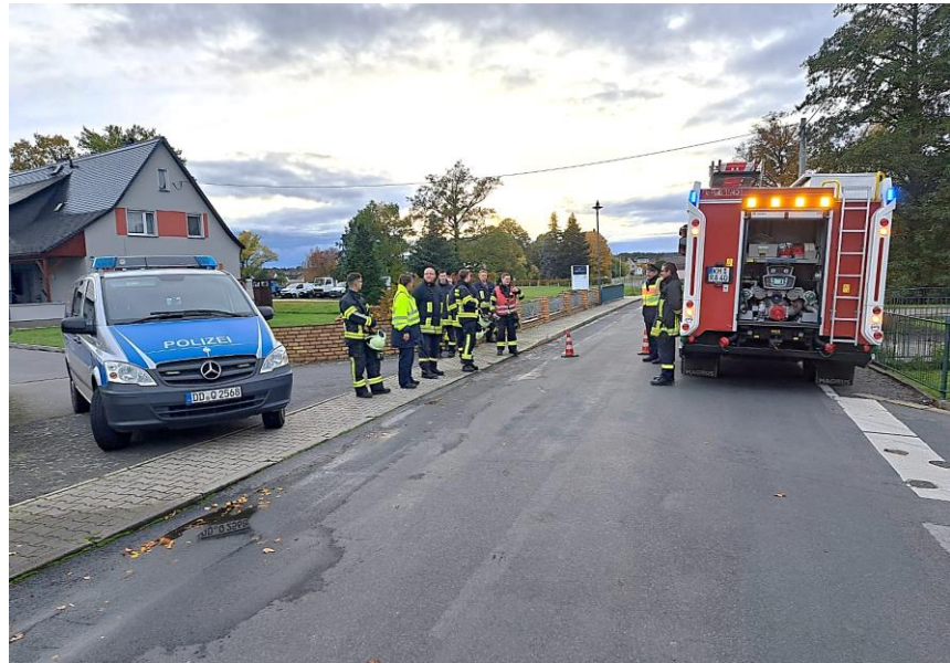
Foće: Wohnjowa wobora Ralbicy-Róžant

Jako namakachu 31. oktobra w Šunowje při twarskich džětach bombu z Druheje swětoweje wójny, bu zaraćenski kruh wot 600 metrow postajeny. Tak dyrbjachu wšitcy wobydlerjo Šunowa a někotři Konječeno swoje domy wopušćić. Tute ewakuěrowanje bě za wohnjowu woboru našeje gmejny dotal najwobšěrniše zasadženje, kotrež běše tež džakowano zrozumjenja potrjechenych wobydlerjow wuspěšne.