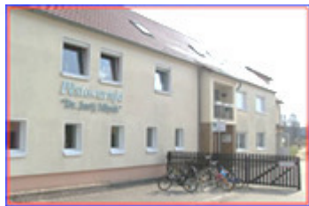
pěstowarnja „dr. Jurij Mlynk“ w Ralbicach